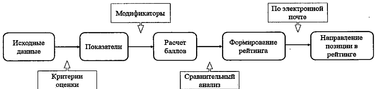
Рисунок 3 – Алгоритм присвоения рейтинга

8.10 Схематично присвоение Рейтинга представлено на рисунке 3.