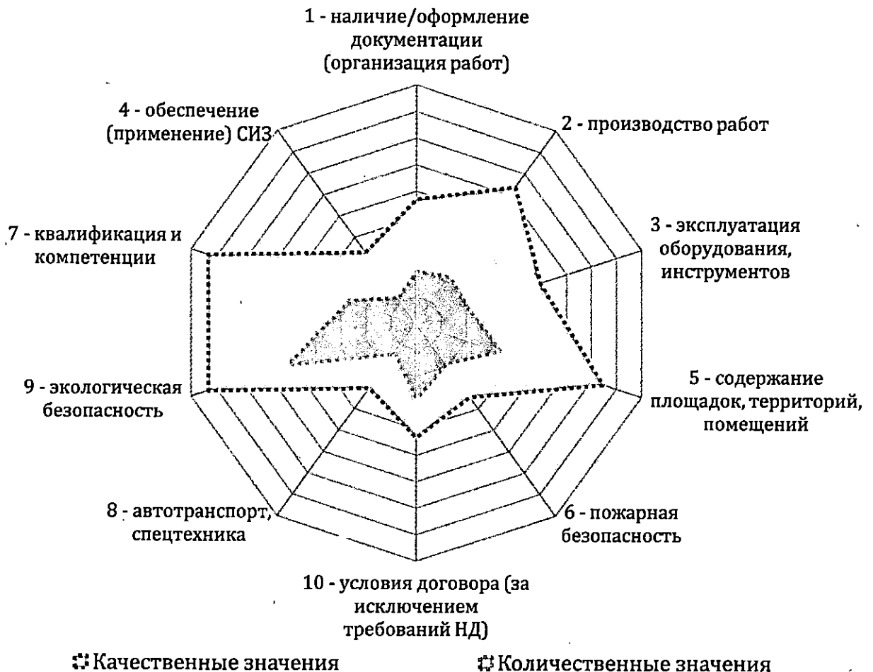
Рисунок 1 – Пример лепестковой диаграммы для визуализации несоответствий

с учетом цветовых кодов по уровням опасности, используется лепестковая диаграмма, которая учитывает совокупную информацию о количественных и качественных показателях несоответствий (Рисунок 1). Лепестковая диаграмма применяется для полной визуализации по всем Подрядным организациям или детальной визуализации для каждой Подрядной организации.